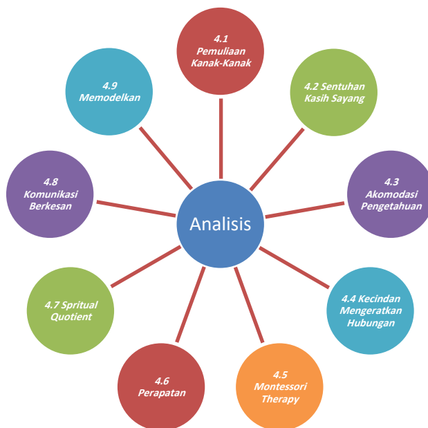
Rajah 2.0: Analisis Hadis Ya Aba Umayr Terhadap Interaksi Sosial Kanak-Kanak

kanak. Kanak-kanak dalam proses pembelajaran dan peniruan memerlukan tingkah laku yang baik untuk ditiru dan diamalkan. Sesuai dengan pendekatan yang dibawa oleh Rasulullah SAW.