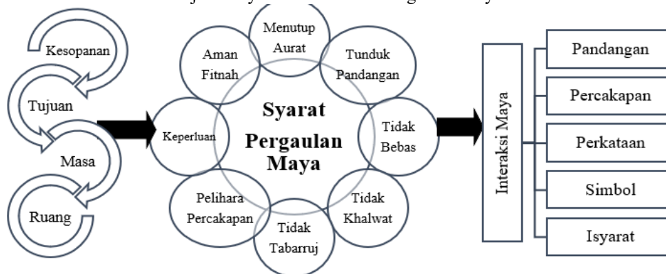
Rajah 1: Syarat dan Aktiviti Pergaulan Maya

Semua pengukuran di atas berfungsi sebagai pelengkap kepada prinsip asas pergaulan yang telah ditetapkan oleh syarak. Dalam konteks komunikasi digital, pematuhan terhadap garis panduan ini menjadi asas penting bagi memastikan interaksi maya kekal dalam lingkungan yang diharuskan serta tidak membawa kepada bentuk khalwat yang dilarang.