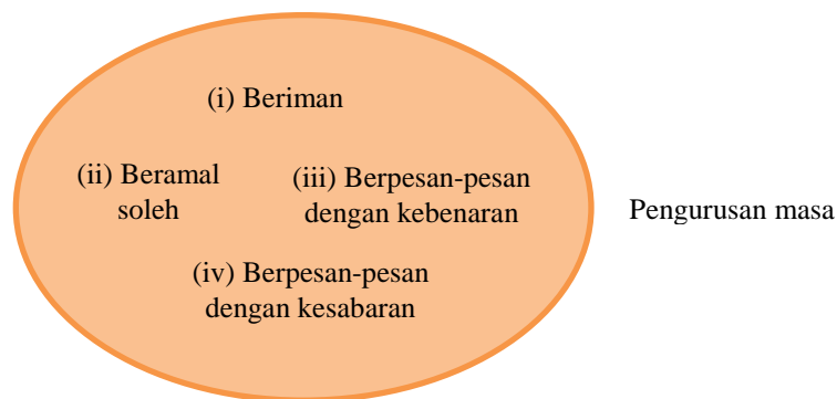
Rajah 1: Sifat Orang yang Berjaya dalam Pengurusan Masa